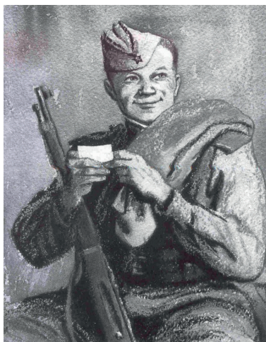
О.Г. Верейский. Василий Тёркин. Иллюстрация к поэме А.Т. Твардовского «Василий Тёркин».

Упражнение 223. Прочтите вступление к поэме «Василий Теркин».