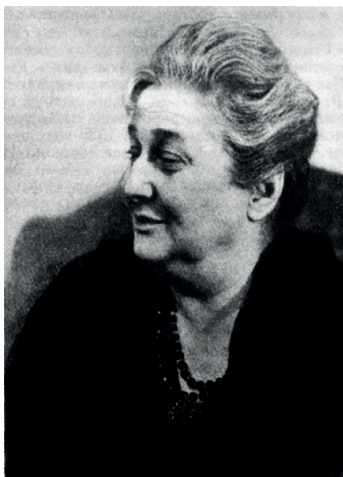
А.А. Ахматова. Фото. 1965 год

Упражнение 214. Прочитайте текст о русской поэтессе Анне Ахматовой и выучите наизусть стихотворение “Клятва”.