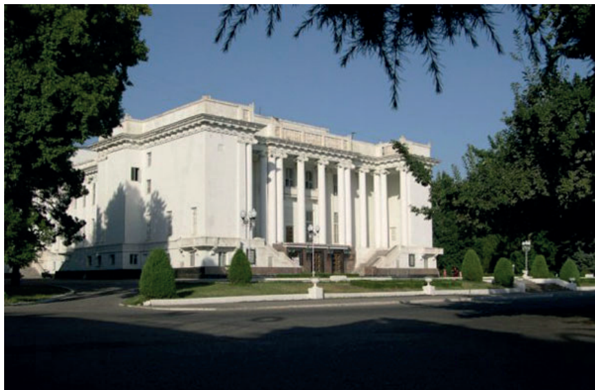
Душанбе. Театр оперы и балета имени Садриддина Айни

* под созвездием твоим – под твоими звездами, под твоим небом